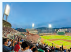
スポーツや観戦で