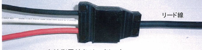
支線側電線色は一例です。

このバイパス工具は、多回路の分岐、分配に対応します。 外觀が樹脂製ですので安全に電線に取付出来ます。 対応する電線もビニル被覆電線、負荷側5.5~22sq使用でき 受電側のリード線は最大120Aと大容量の電流を流すことが できます。接続端子は分離型ですので、取りつけやすく、弊社 オリジナルのワンタッチ式又はねじ込み式を選択できます。